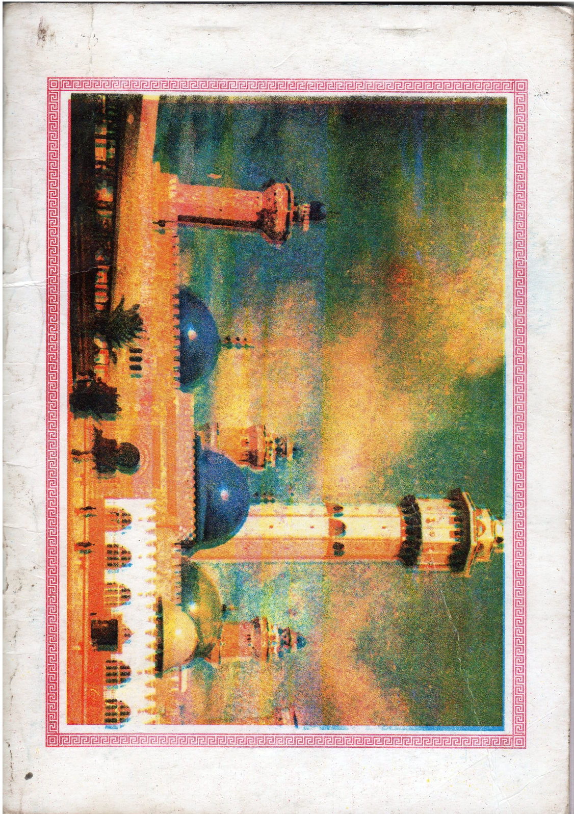
Dieureudieuffé Cheikh Ahmadou Bamba Mbacké, Khadimou Rassoul, Le Serviteur Privilégié du Prophète Muhammad Sallallahu Alaihi Wa Salam.